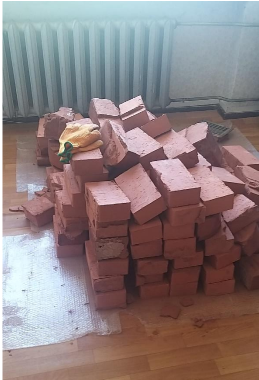
4.att. "Kamīns" demontētā veidā.