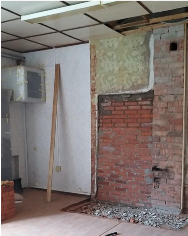
5.att. Kamīna vietā tika izveidota siena.