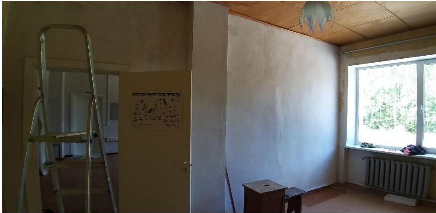
7.att. Darba procesā.