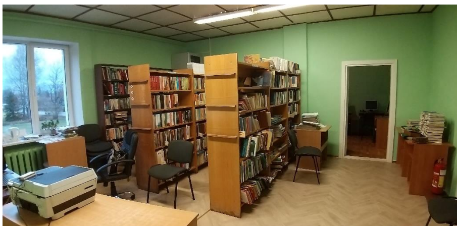
10.att. 9.novembris, Bibliotēka atgriezusies savās telpās pēc remonta pabeigšanas.