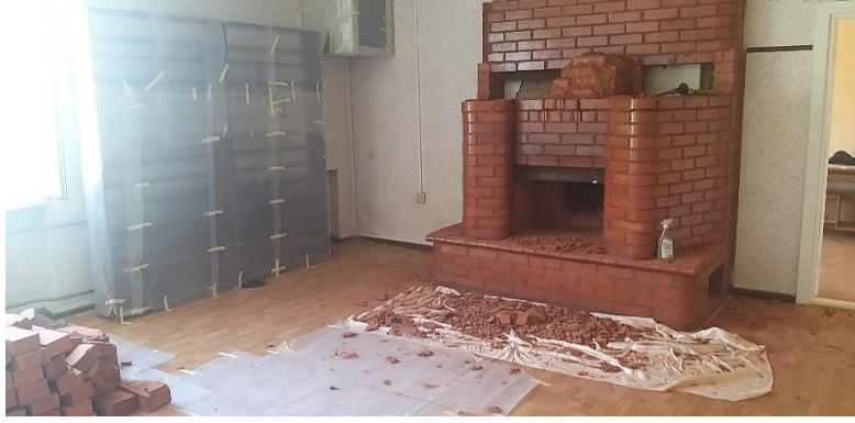
3.att. Darba procesā.