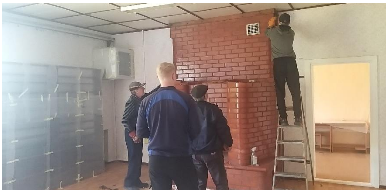
2.att. Tiek uzsākta kamīna demontāža.