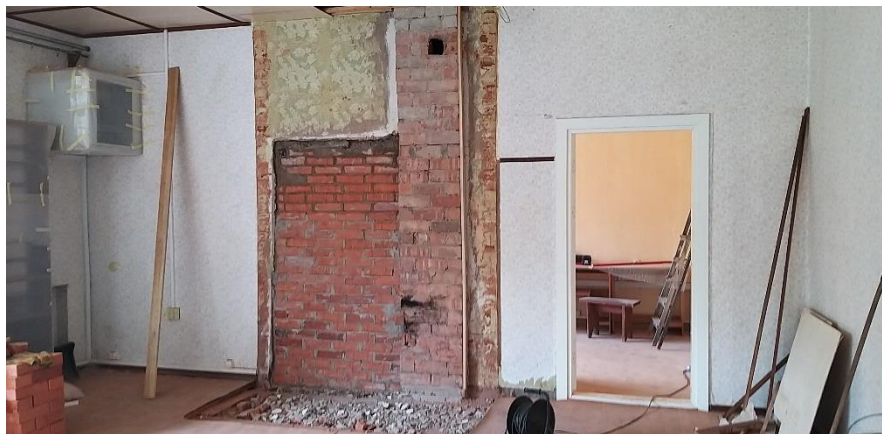
6.att. Darba procesā.