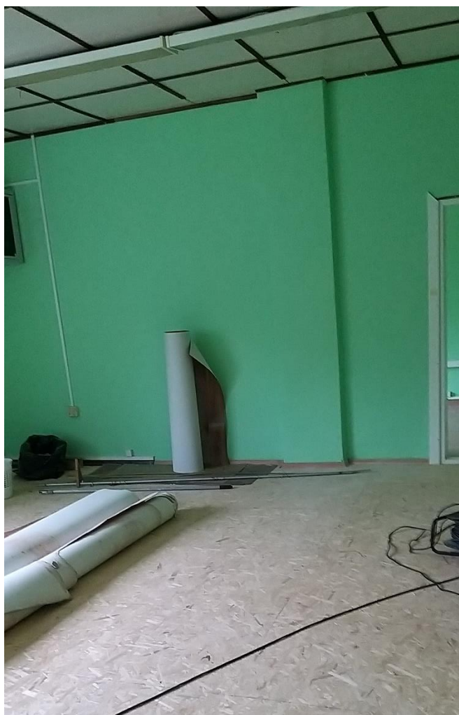
8.,9.att. Bibliotēkas telpu sienas ieguva jaunu krāsojumu.