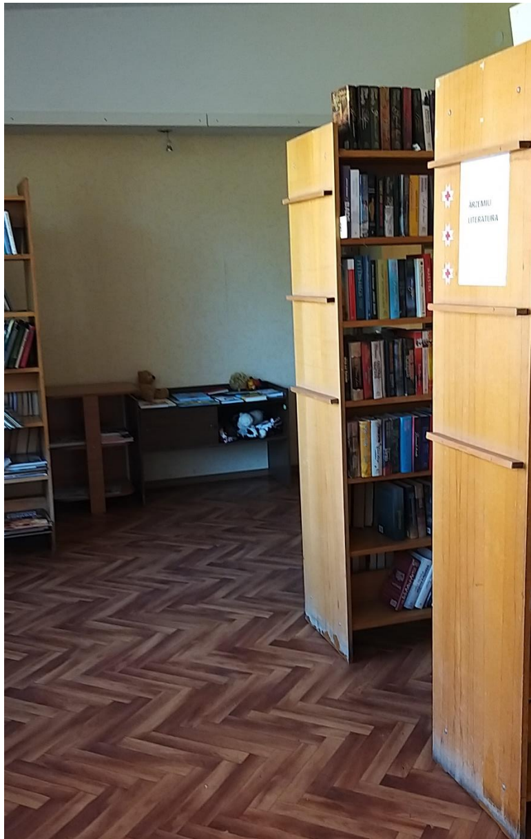
11.att. Bibliotēkas pagaidu telpa.

Bibliotēkas telpu remonta laikā bibliotēka atradās nelielā telpā, tāpēc šajā pārskata periodā nebija iespējas rīkot pasākumus un izstādes. Bet pārējie bibliotēkas pakalpojumi, bibliotēkas lietotājiem tika nodrošināti.