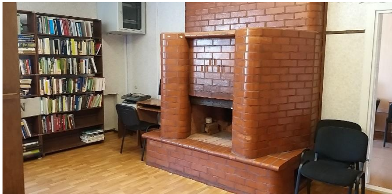
1.att. Kamīns pirms demontāžas.