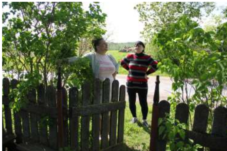
Krucifiksu apzināšanas brauciens