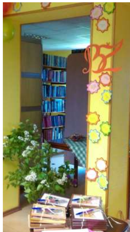
No Bērnū, jauniešu žūrijas noslēguma pasākuma