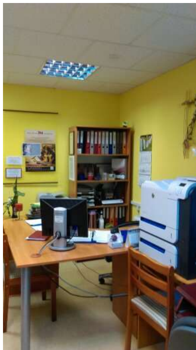
Jaunais krāsainais printeris