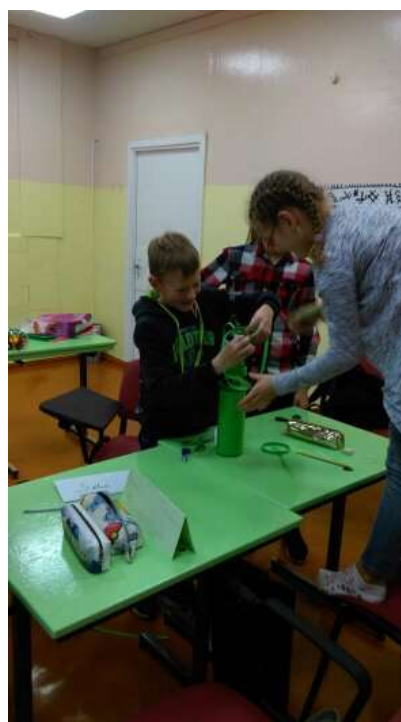
No 5.-9. klašu konkursa norise