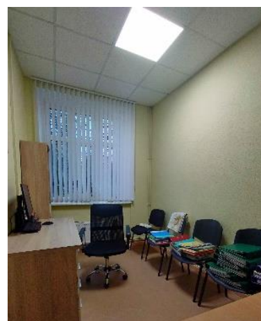
Bibliotēkas telpa remonta laikā

Pārskata periodā vienā no bibliotēkas telpām veikts kosmētiskais remonts. Abās telpās nomainīts apgaismojums. Iegādāti 6 jauni grāmatu plaukti. Bibliotēkas telpas ieguva patīkamu vizuālo izskatu. Apmeklētāji pozitīvi novērtē gan jauno iekārtojumu, gan apgaismojumu. Pakalpojumu sniegšana bibliotēkas apmeklētājiem uz remonta laiku netika atcelta.