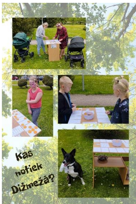
Atskats uz pasākumu "Kas notiek Dižmežā?"

Sadarbība notiek ar pašvaldības mācību iestādēm - organizējot informatīvi izglītojošas ekskursijas bibliotēkā, apmeklētāji uzzina par bibliotēkas vēsturi un pakalpojumiem.