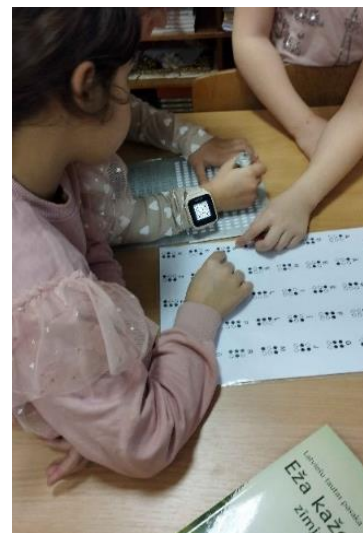
Attēls no pasākuma "Cilvēks," kas tumsā nesa gaismu"

Bērniem nodrošināta brīvpieeja krājumam, iespēja izmantot datoru mācību vajadzībām, drukas, skenēšanas, kopēšanas, iesiešanas pakalpojumi, interneta pieslēgums, abonētās datubāzes, uzziņas un konsultācijas, pasākumi, izstādes un ekskursijas.