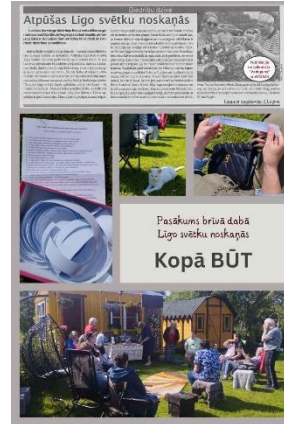
Atskats uz pasākumu "Kopā BŪT"