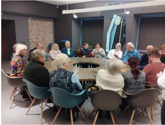
Pasākums Balvu novada muzejā "Spēka zīmes Latvijai"