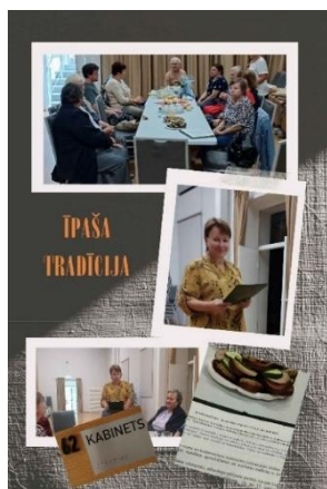
Atskats uz pasākumu “Īpaša tradīcija”

Būtiski palielinājās apmācību skaits viedtālrunu izmantošanas jautājumos. Novērota šāda tendence – bērni vai mazbērni uzdāvina senioram viedtālruni, bet “aizmirst” pilnvērtīgi apmācīt to lietot. Tad nu