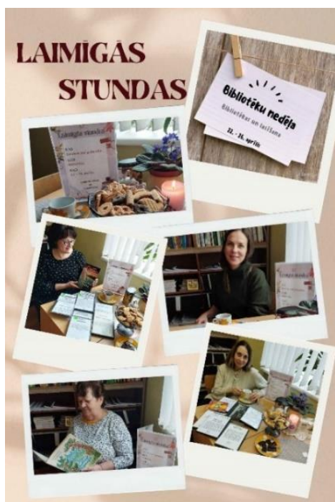
Atskats uz pasākumu "Laimīgās stundas"

Ir samērā liela bibliotēkas apmeklētāju daļa, kas "nav draugos" ar tiešsaistes saziņas iespējām. Viņi ir jāuzrunā personīgi.