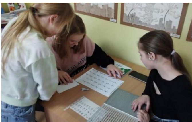
Bērni mēģina uzrakstīt savu vārdu Braila rakstā

Bērniem nodrošināta brīvprīgie krājuma, iespēja izmantot datoru mācību vajadzībām, drukas, skenēšanas, kopēšanas, iesiešanas pakalpojumi, interneta pieslēgums, abonētās datubāzes, uzziņas un konsultācijas, pasākumi, izstādes un ekskursijas.