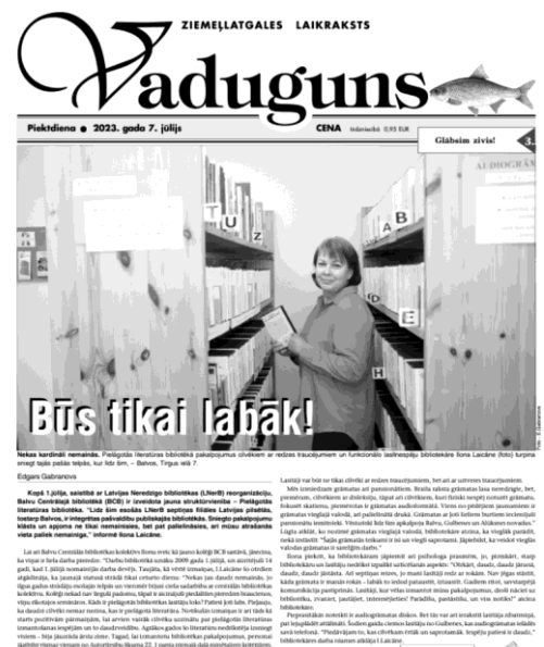
Publikācija par bibliotēkas reorganizāciju

• Sadarbība novadpētniecības jomā Bibliotēka apkalpo Balvu, Alūksnes, Gulbenes un Smiltenes novados dzīvojošus neredzīgus un vājredzīgus iedzīvotājus. Lai papildinātu mapes ar jauniem materiāliem no reģionālajiem preses izdevumiem, izveidojusies laba sadarbība ar novadu bibliotēku darbiniekiem, kuri pēc pieprasījuma ieskenē nepieciešamo informāciju.