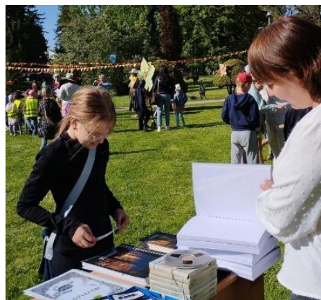
Dalība Balvu CB rīkotajos dārza svētkos pilsētas skvērā.