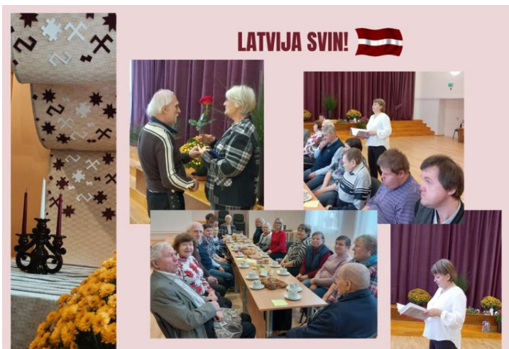
18. novembrim velīts pasākums Vīksnas tautas namā

Braila rakstā tika sagatavoti un izdrukāti dažādi, lietotājam nepieciešami, mācību materiāli.