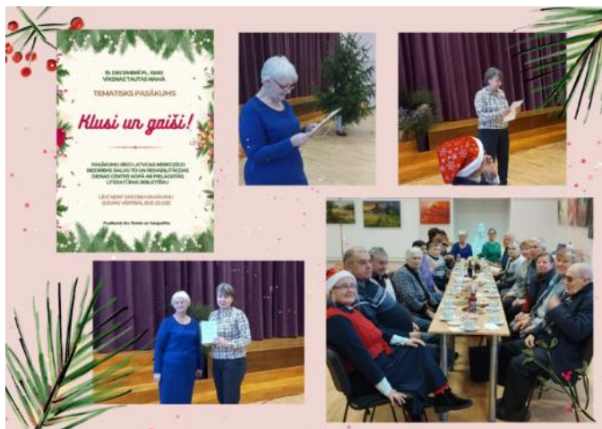
Ziemassvētku pasākums Vīksnā

Darbs ar parādniekiem veikts reizi divos mēnešos, izmantojot dažādus saziņas veidus. Lielu problēmu nav, tomēr dažreiz gadās, ka lietotāji snieguši nepatiesus kontaktus vai tie ir mainījušies, daži vienkārši ignorē atgādinājumus. Ir gadījumi, ka telefons, adrese nomainīta vai neviens nav paziņojis par personas nāvi.