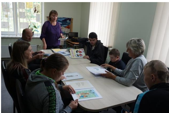
Tikšanās Beņislavas dienas aprūpes centrā

Palielinoties krājumam, turpinām bērniem ar lasīšanas grūtībām piedāvāt grāmatas vieglajā valodā un mācību grāmatas pielāgotā formātā.