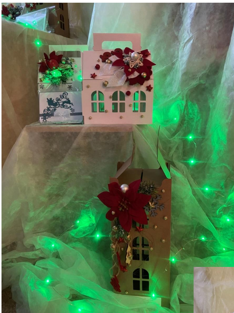
Izstāde „Apsveikums kā mākslas darbs”. Agritas Lužas darinātie apsveikumi izstādē.