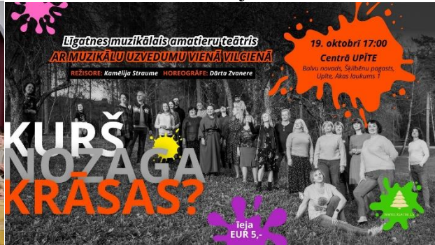
1 foto Stāsta Balto grāmatu. 2foto. Līgatnes amatiereteātra afiša.