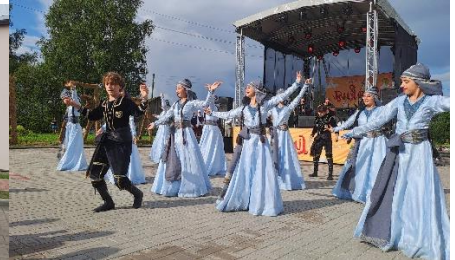
Tālākie folkloras festivāla “Lipa kust” dalībnieki. Kostarika, Čehija, Gruzija.