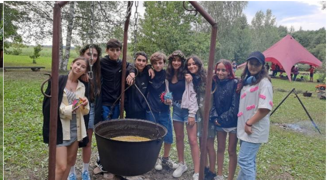
1 foto. Stāstnieku festivāla dalībnieki pie zupas. 2 foto. Gruzijas jaunieši pie zulas.