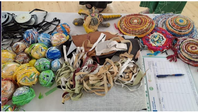
1 foto. Latvijas leļļu teātris “Vaļa dziesma”. 2 foto. Biedrības “Radošās idejas” meistarklase.