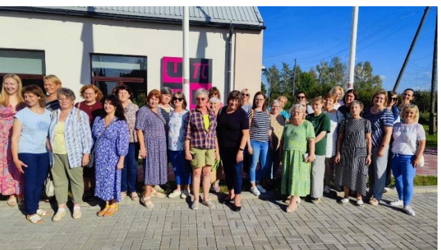
1 foto. Latvijas bibliotekāru biedrības pārgājiens. 2 foto. Madonas bibliotekāri.