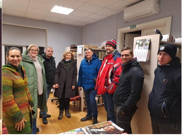
1 foto Tilžas skolēni Upītē. 2 foto. Ekskursanti no Varakļāniem.