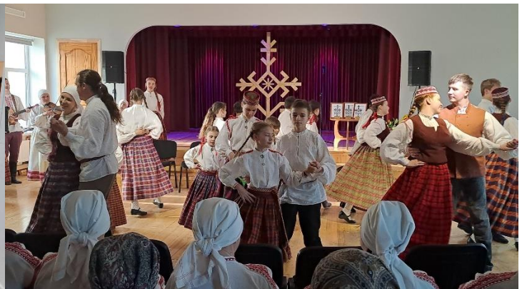
1 foto. Zvaigznes ABC grāmatu svētkos Balvu muižā. 2 foto. Austras koks.