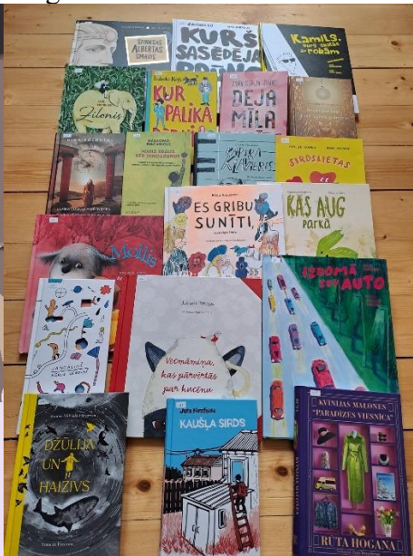
1 foto. “Omotu stuostu” festivāla afiša. 2 foto. Bērnu žūrijas grāmatas.