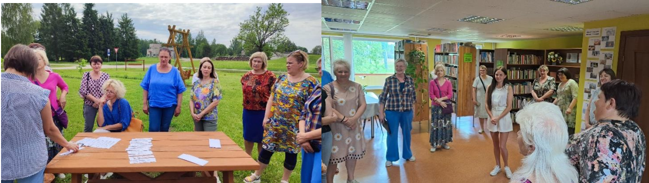
5 foto. Izbraukuma seminārs.; 6foto. Meistardarbnīcas PEPT pasākumā.